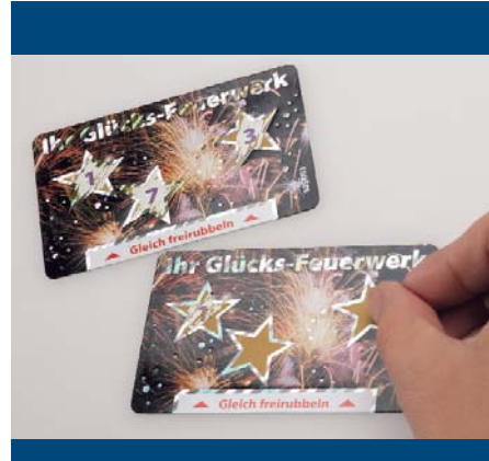
Rubbellose wecken den Spieltrieb und motivieren zum Handeln.